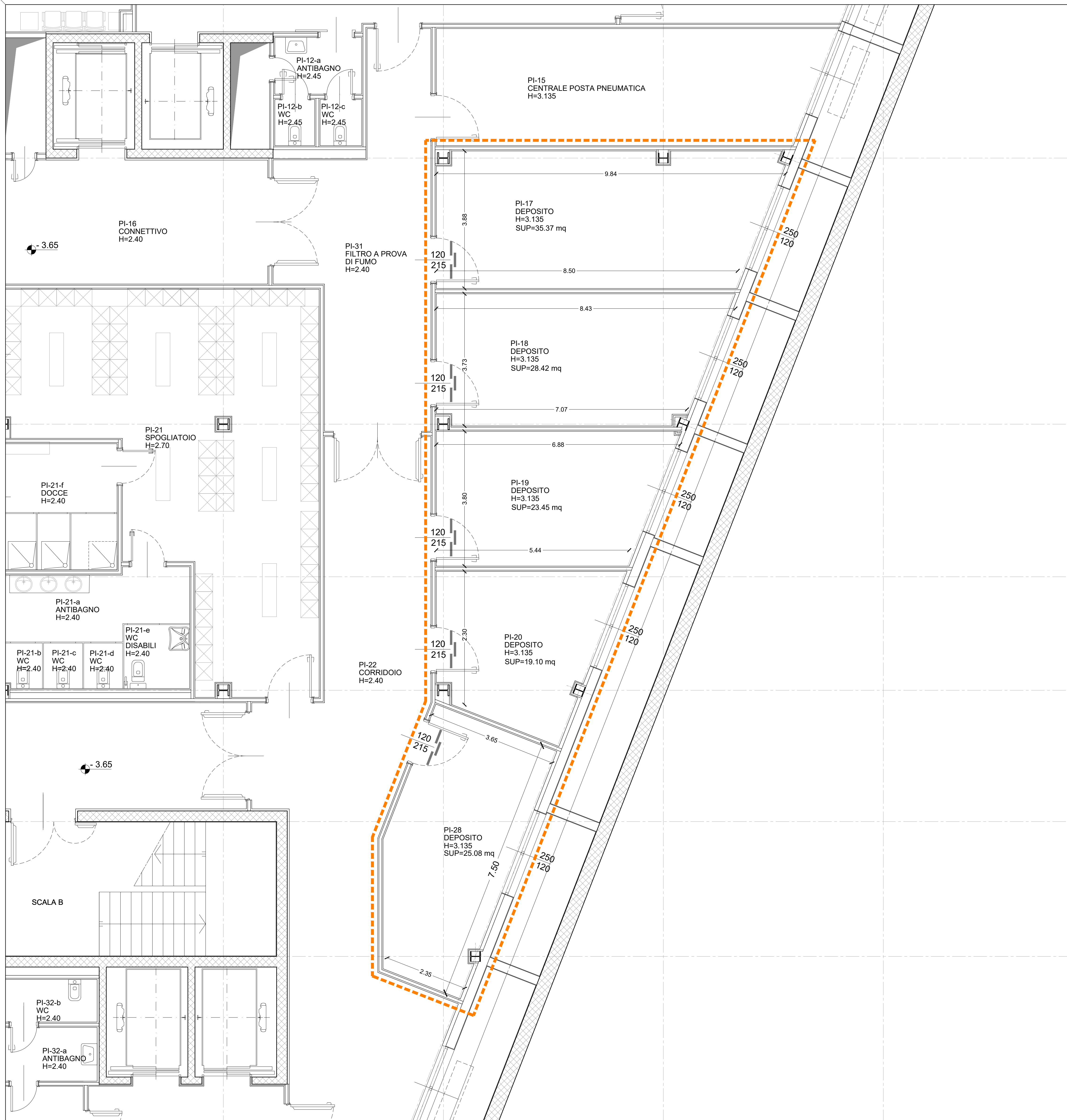
PROGETTO: LIVELLO -1 (Piano Interrato) - Quotato